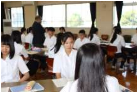
夏休み中(7月23~24日)に開催した就職支援セミナーの様子