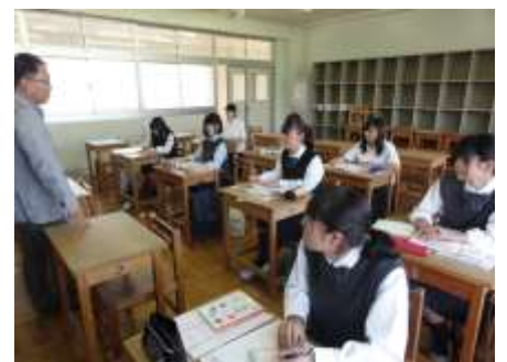
6月7日に開催した進学ガイダンスの様子

3年生の進学希望者はいよいよ10月から本格的に入学試験が始まります。試験開始に向けて十分な準備・対策を進めてください。