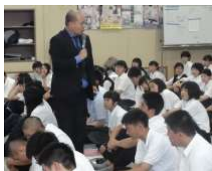
7月の進路セミナーの様子